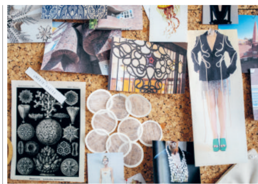
Het moodboard van de ontwerpers van Martan.

'Daar kan je je eigen realiteit creëren, door te klikken op beelden die jij leuk vindt en waardoor je vervolgens louter soortgelijke leuke dingen krijgt voorgeschoteld waardoor je in een vacuüm terecht komt. Kijk je geen journaal en lees je geen kranten, dan zie je niet dat Pakistan is overstromd. Je staat ver van de realiteit. Je leeft in een schijnwereld en je gaat lekker bestellen. Ze zijn de negatieve verhalen waarmee je om de oren wordt geslagen zat.'