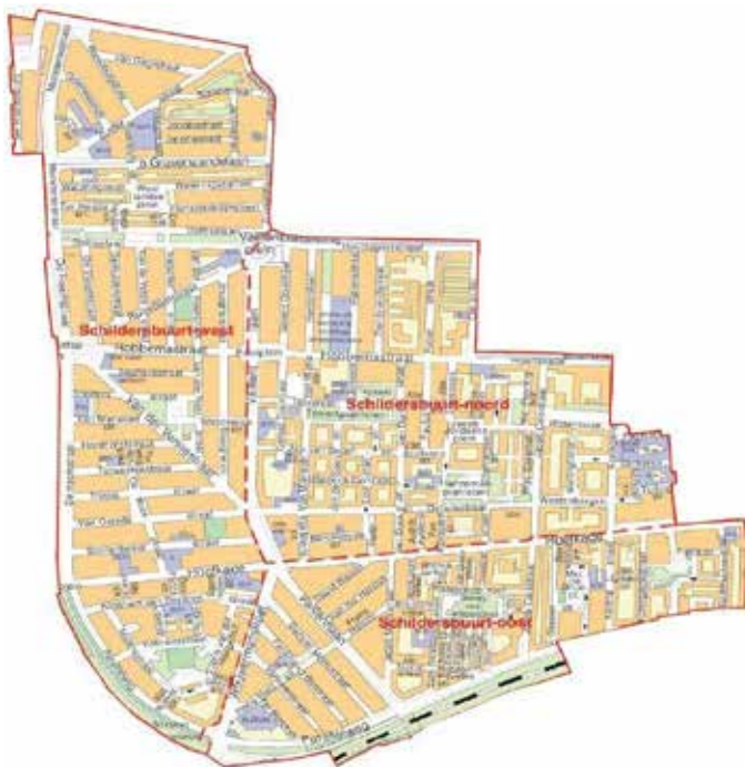
Figuur 1: plattegrond van de Schilderswijk

immigratieachtergrond. 4 Er wonen relatief veel gezinnen met kinderen en een-oudergezinnen in de wijk vergeleken met de gemeente Den Haag in het geheel. De belangrijkste etnische groeperingen zijn bewoners van Turkse (8.600, 28 procent), Marokkaanse (7.200, 23 procent), Surinaamse (5.400, 18 procent), overige niet-westerse (4.560, 15 procent), Nederlandse (2.700, 8,6 procent) en Oost-Europese (1.160, 3,8 procent) afkomst. Ter vergelijking: in de gehele gemeente Den Haag was de verhouding tussen 'autochtone' Nederlanders en inwoners met een immigratieachtergrond in 2016 respectievelijk 47,9 en 52,1 procent (DHIC, GDH, DPZ, 2017, in Den Haag buurtmonitor, z.j.). In de Schilderswijk heeft van de jongeren tot en met 25 jaar 30,6 procent een Turkse achtergrond, 27,5 procent een Marokkaanse, 10,5 procent een Surinaamse, 2,8 procent een Antilliaanse, en 6,5 procent een Nederlandse achtergrond. Daarnaast behoort 15,4 procent van de jongeren tot de categorie overige met niet-westerse achtergrond, en 6,7 procent tot de categorie overige met een westerse achtergrond (DBZ, GBA, 2017, in Den Haag buurtmonitor z.j.).