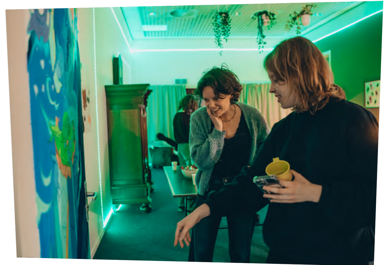
Foto: opening getransformeerde tienerruimte op gemeentelijke opvanglocatie. (zie pagina 23)

De respondenten zijn afkomstig uit verschillende steden in Oekraïense. Een klein deel van de respondenten woonde eerder in door Rusland bezette gebieden in Oekraïne (N=4). Zie figuur 1 voor een overzicht. Het grootste gedeelte van de respondenten verblijft momenteel in een gemeentelijke opvanglocatie in Nederland (N=14), de overige respondenten huren een appartement of studio zelfstandig ofwel samen met hun ouder(s). Dit betreft met name respondenten die inmiddels hun vervolgopleiding volgen.