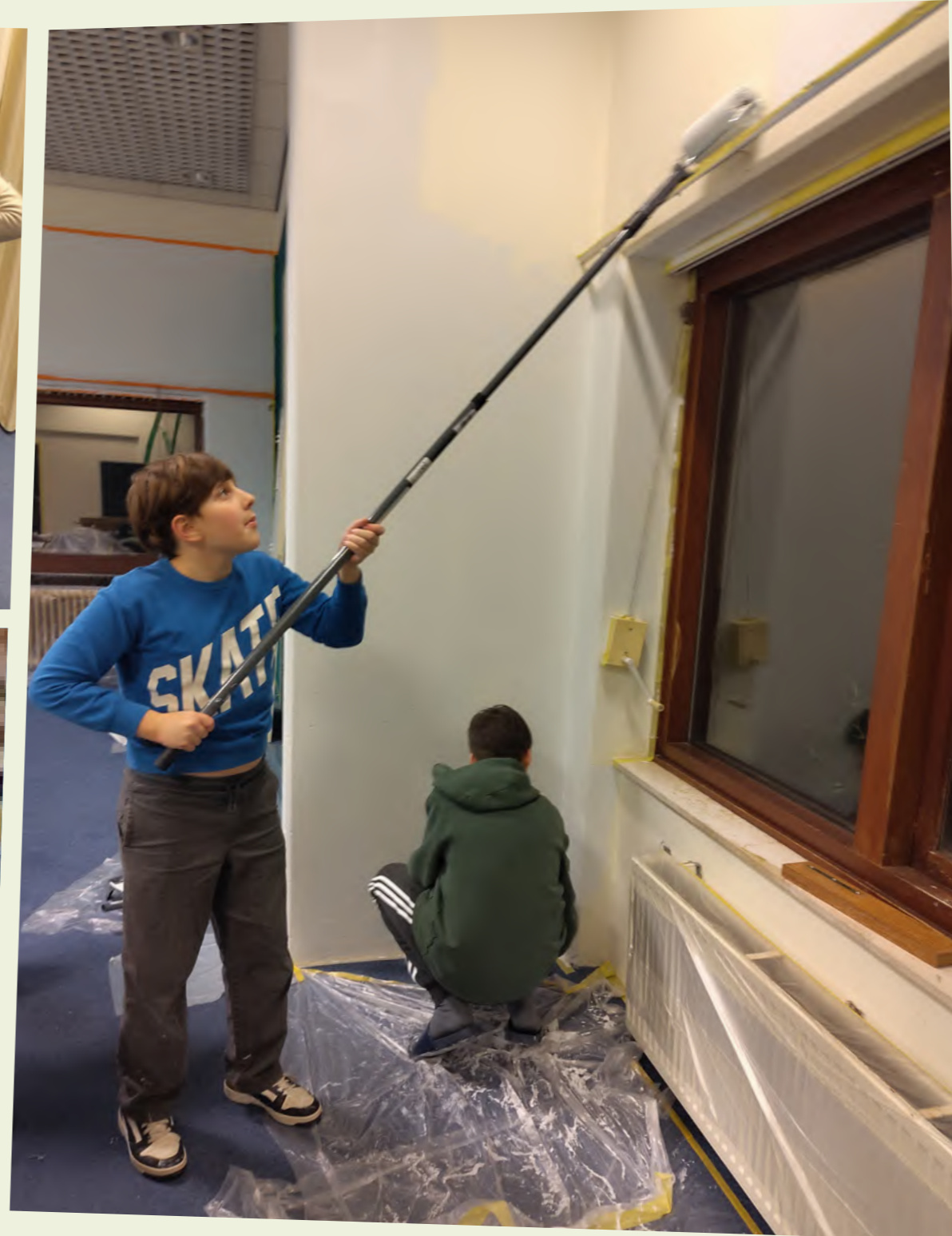
Foto's: Bijeenkomst met tieners, overleg over ontwerp en ingrijpen op locatie.