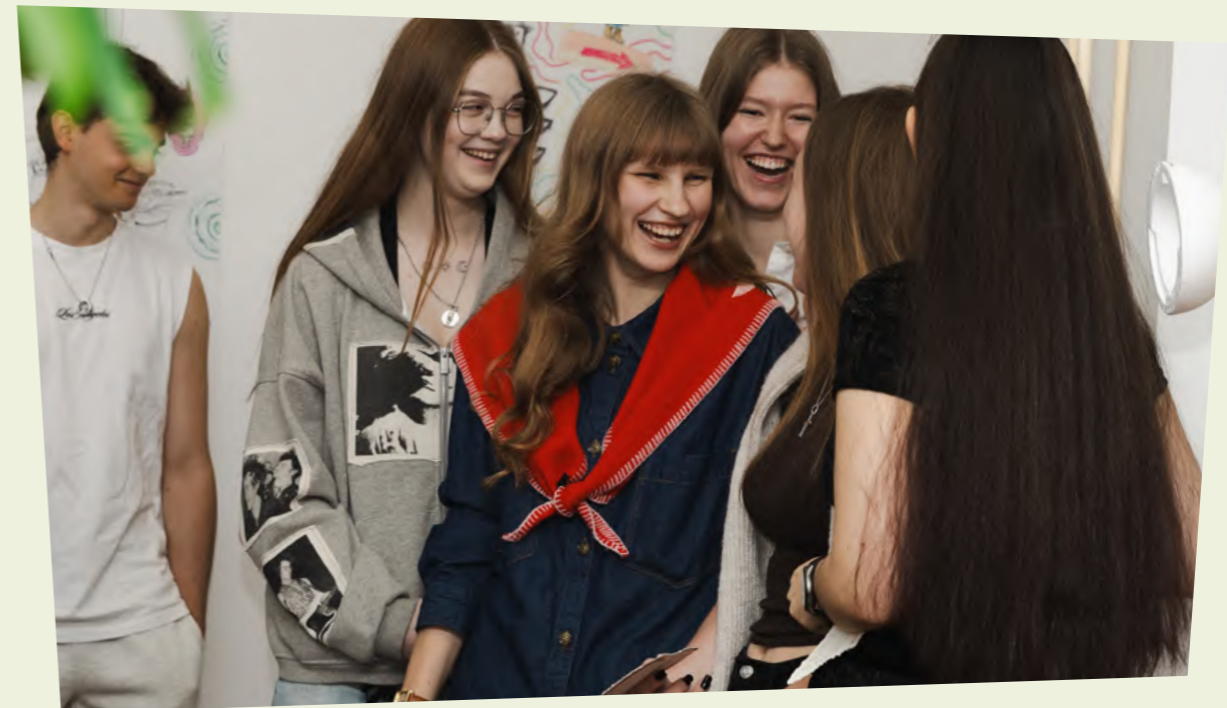
Foto: Opening van tentoonstelling Autumnschool.

aHOUSEforHOME Autumn school is mogelijk gemaakt door VATAHA Foundation en Urban Reform, in samenwerking met De Haagse Hogeschool, met steun van de Gemeente Den Haag, Stroom Den Haag, Jeugdvakantieloket en Stichting Van Bylandt.