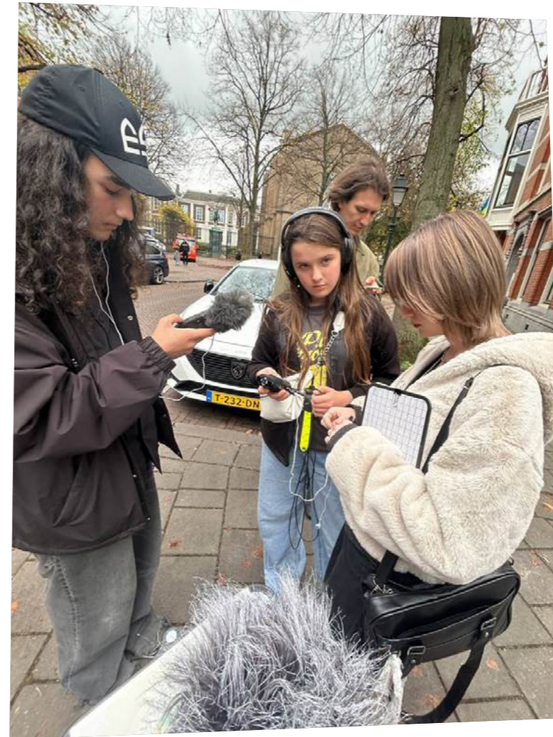
Foto's: project aHOUSEforHOME 2025 door team AHFH (zie pagina 28)

De semigestructureerde interviews werden afgenomen aan de hand van een topic list met vragen over verschillende categorieën: het dagelijks leven, welzijn, gezondheidszorg en copingmechanismen, het sociale netwerk en de toekomst.