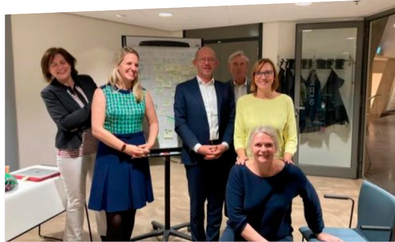
Co-creatieworkshop Trust MEDIators