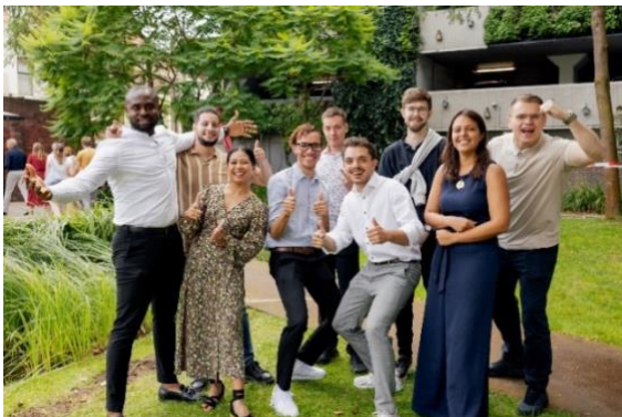
Studentleden Hogeschoolraad tijdens de startconferentie in augustus 2024

Omdat het merendeel van de leden haar tweede termijn in ging was er veel ruimte voor het reflecteren van het eerste jaar. Met elkaar werd gekeken waar de successen en leerpunten lagen om die mee te nemen. Het CvB en de RvT sloten aan en er werd met elkaar gediscussieerd over lopende dossiers, elkaars rollen en wederzijdse verwachtingen. De startconferentie is door alle deelnemers positief ontvangen.