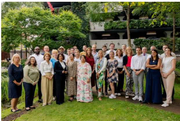
Leden van de HR, CvB en RvT tijdens de startconferentie in augustus 2024

CvB – Medio 2024 is in gezamenlijk overleg besloten om naast de formele vergaderingen ook regelmatig een informele dialoogtafel te plannen waar het DB en de voorzitter van het CvB signalen met elkaar bespreken die niet formeel geagendeerd worden maar wel van belang zijn om te bespreken. Deze gesprekken werden door het DB als prettig en belangrijk ervaren.