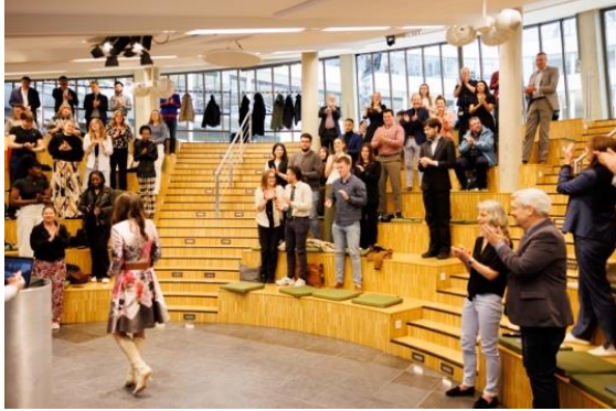
Bekendmaking uitslag 12 juni 2024

Van 27 mei tot en met 9 juni 2024 vonden er verkiezingen bij De Haagse Hogeschool plaats voor de 188 vacante zetels bij de raden en commissies. Met 257 kandidaten vonden er in 32 kiesdistricten verkiezingen plaats.