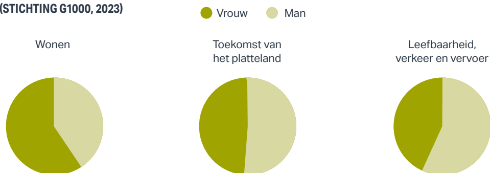
FIGUUR 1. VERDELING VAN GENDER OVER DE DRIE THEMATISCHE BURGERBERADEN (STICHTING G1000, 2023)

Daarnaast waren er relatief veel jongeren (16-25 jaar) ingeloot voor het burgerberaad Wonen en relatief weinig voor het burgerberaad Toekomst van het platteland (Intern Evaluatierapport burgerberaad G1000Zuid-Holland, 2023). Bij het burgerberaad Wonen was de verdeling theoretisch en praktisch opgeleide deelnemers precies zoals het beoogde doel (31% respectievelijk 69%). Echter, bij de burgerberaden Toekomst van het platteland en Leefbaarheid, verkeer en vervoer waren relatief meer inwoners met een theoretisch opleidingstype ingeloot dan het beoogde doel voor een goede afspiegeling (46% respectievelijk 48%) (Intern Evaluatierapport burgerberaad G1000Zuid-Holland, 2023).